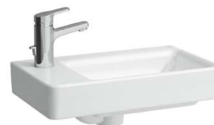
Umývatko, asymetrické levé 480 x 280 x 85 mm