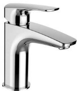
LAUFEN LAURIN Umývatková baterie