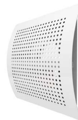
Stěnový rezidenční difuzor, čtyřhranný