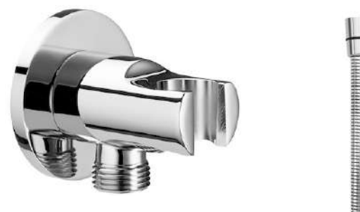
Připojení sprchové hadice 1/2" s držákem ruční sprchy