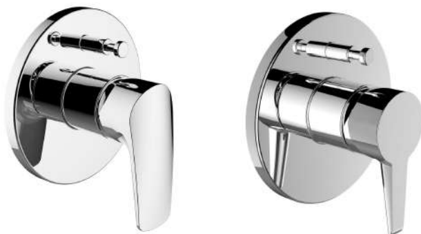
Laufen vrchní sada podomítkové vanové / sprchové baterie s přepínačem, chrom