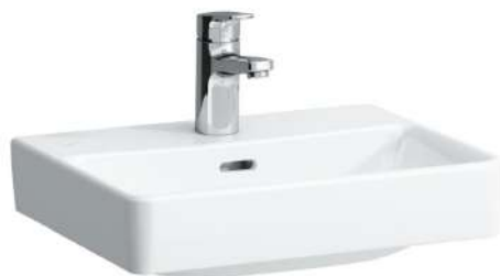
Umývatko 450 x 340 x 85 mm