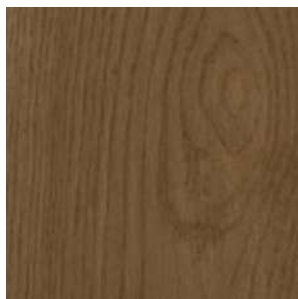
Dub tmavě hnědý