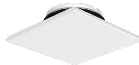
Odvodní hranatý ventil