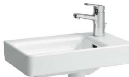
Umývatko, asymetrické pravé 480 x 280 x 85 mm