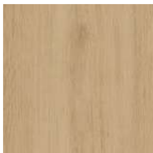
Vanilla Liberty Jasan