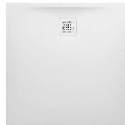
Sprchová vanička Laufen Pro