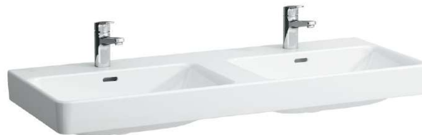
Dvojumyvadlo 1200 x 465 mm