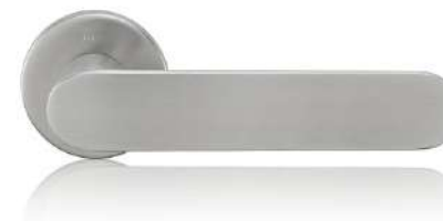
Klika s kulatou rozetou