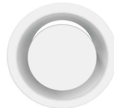
Odvodní talířový ventil