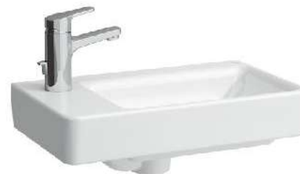
Umývatko, asymetrické levé 480 x 280 x 85 mm