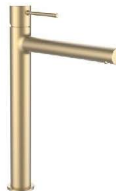
LAUFEN TWINPLUS Umyvadlová baterie