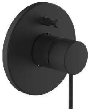
LAUFEN Twinplus SL Concealed podomítková páková vanová/ sprchová baterie