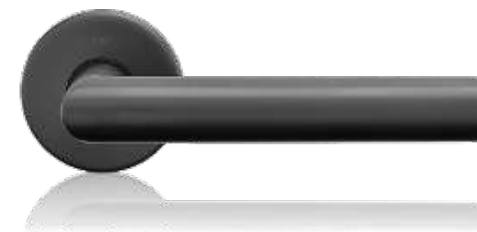
Klika s kulatou rozetou