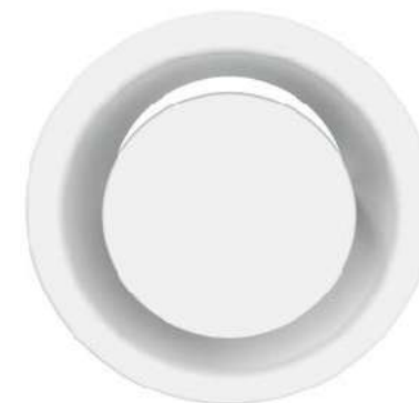
Odvodní talířový ventil