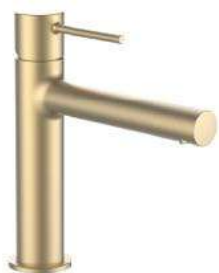
LAUFEN TWINPLUS Umyvadlová baterie