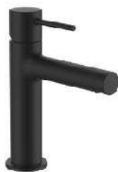
LAUFEN TWINPLUS Umývatková baterie