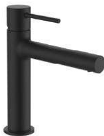
LAUFEN TWINPLUS Umyvadlová baterie