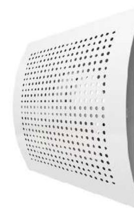
Stěnový rezidenční difuzor, čtyřhranný