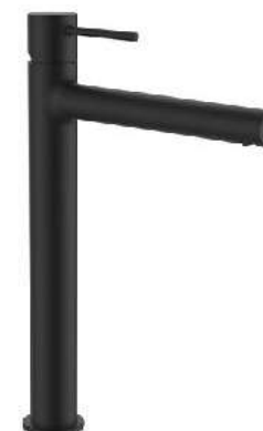
LAUFEN TWINPLUS Umyvadlová baterie