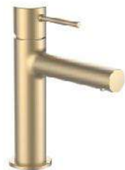
LAUFEN TWINPLUS Umývatková baterie