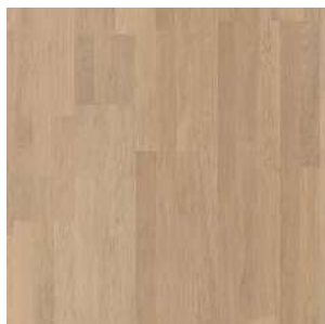
Dub bělený lak