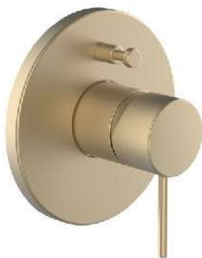
LAUFEN Twinplus SL Concealed podomítková páková vanová / sprchová baterie