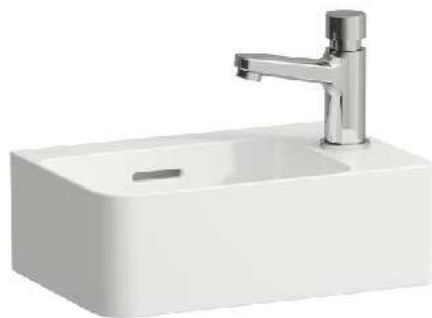
Umývatko 340 x 220 x 115 mm