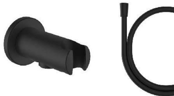
Připojení sprchové hadice 1/2" s držákem ruční sprchy