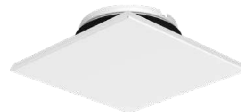
Odvodní hranatý ventil